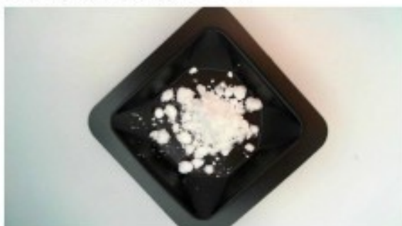
Bild der eingelangten Probe: